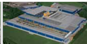
Hörmann KG Brockhagen