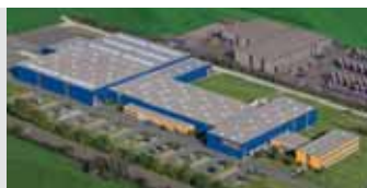
Hörmann KG Antriebstechnik