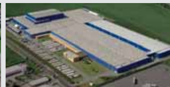
Hörmann KG Ichtershhausen