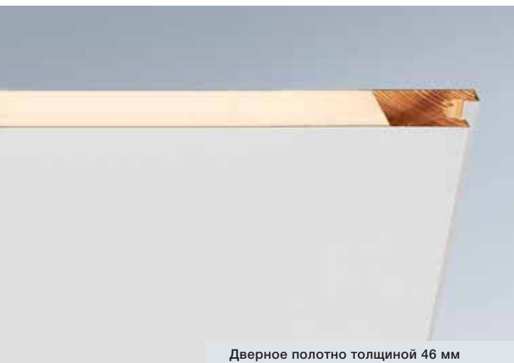
Дверное полотно толщиной 46 мм