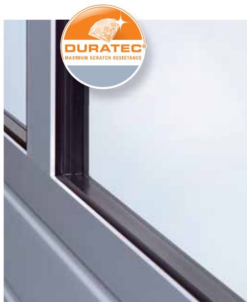
Новое остекление толщиной 26 мм