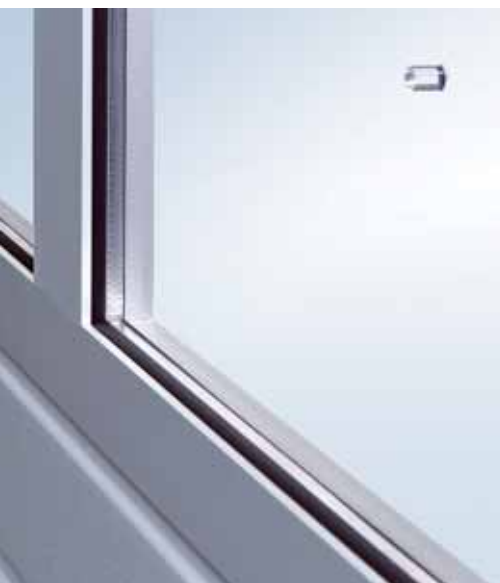
Прежнее остекление с распорными деталями