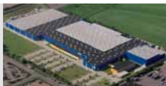
Hörmann KG Brandis