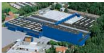
Hörmann KG Amshausen